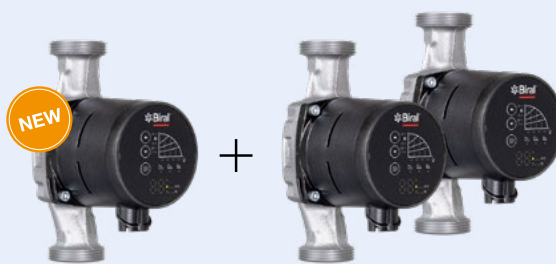
1 x PrimAX 25-5 180